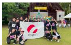
優しい先輩・にぎやかな職場・楽しいイベント 元気に楽しく働ける！！