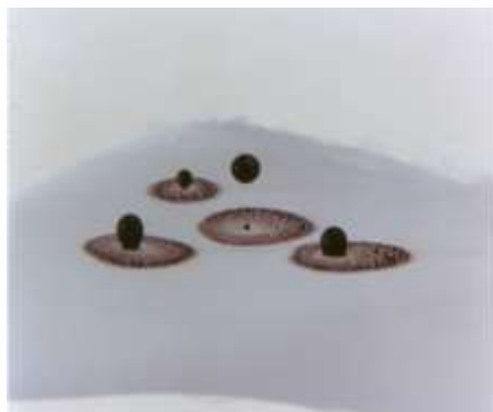
■SR剤によって油汚れが落ちる様子

水を吸わない合成繊維に、親水化技術で吸水性を付与させる製品開発などに取り組んでいます。