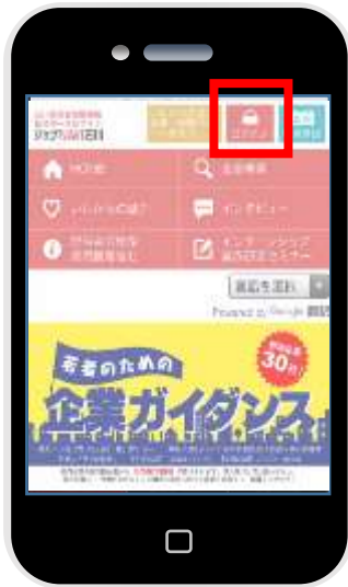
【スマートフォン版】