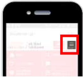
【スマートフォン版】