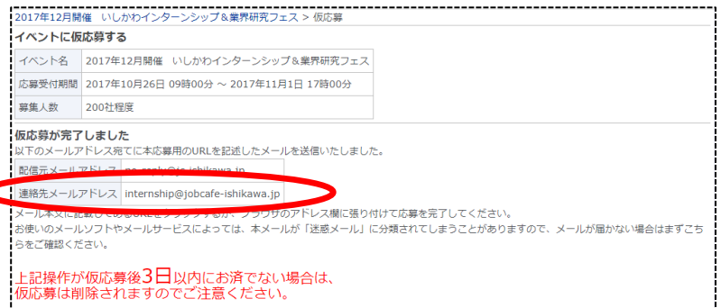
仮応募完了画面スクリーンショット

4. 仮応募完了画面が表示されます。同時に入力いただいた「(5)ご担当者様 E-mail」のメールアドレス宛に仮応募完了メールが自動送信されます。