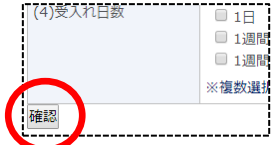
入力画面スクリーンショット