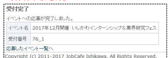
応募完了画面スクリーンショット